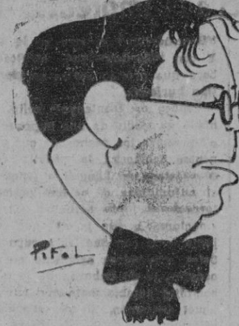
"ELS AMORS DE SA PUBILA"