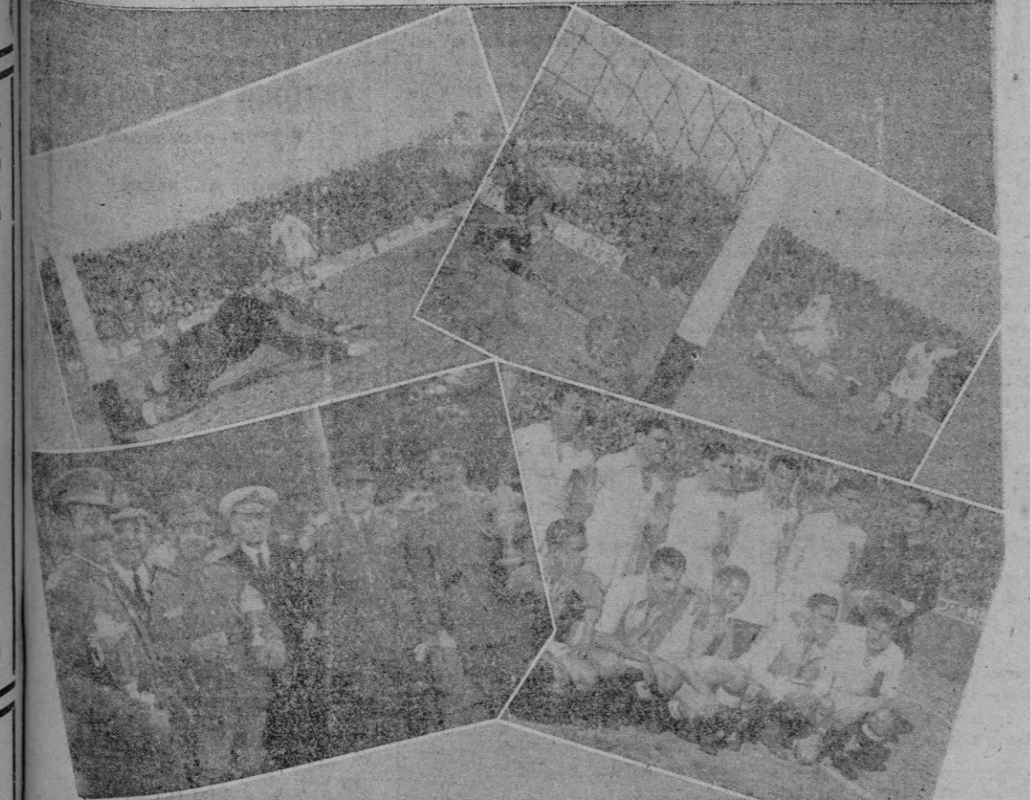
En nuestro reportaje puede ver el lector los dos primeros goles del partido de ayer en “Es Fori” (uno por equipo); los jugadores del “Valencia”, que se acercaron y los vencedores en las pruebas hípticas del sábado junto con las primeras autoridades militares donantes de los trofeos.