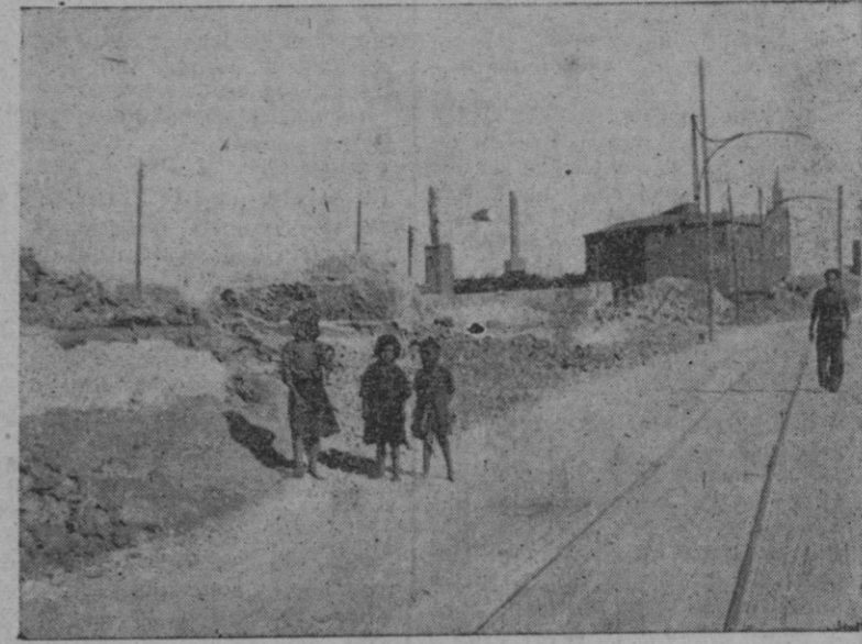
UN «TRIO» CARACTERÍSTICO DE GITANILLOS OBSERVANDO LO QUE FUE SU HOGAR, CONVERTIDO AHORA EN SOLAR PARA URBANIZARLO.

Desde Cartagena se dirige a Ibiza y de allí a Barcelona para seguir a un puerto del Sur de Francia donde se reunirá con sus familiares. La próxima primavera emprenderá el regreso a Nueva York para efectuar la travesía del Pacífico.