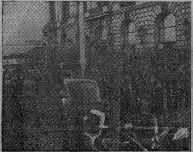
La multitud curiosa acude a ver la salida de la Opera, de los delegados de la Conferencia de San Francisco.