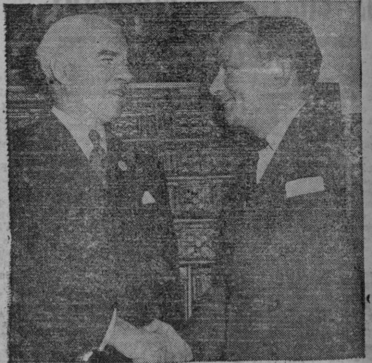
EN SAN FRANCISCO.—El Secretario de Estado Edward R. Stettinius, saluda a Georges Bidault, Ministro Francés de Asuntos Exteriores, en un descanso de las sesiones de la Conferencia de San Francisco.