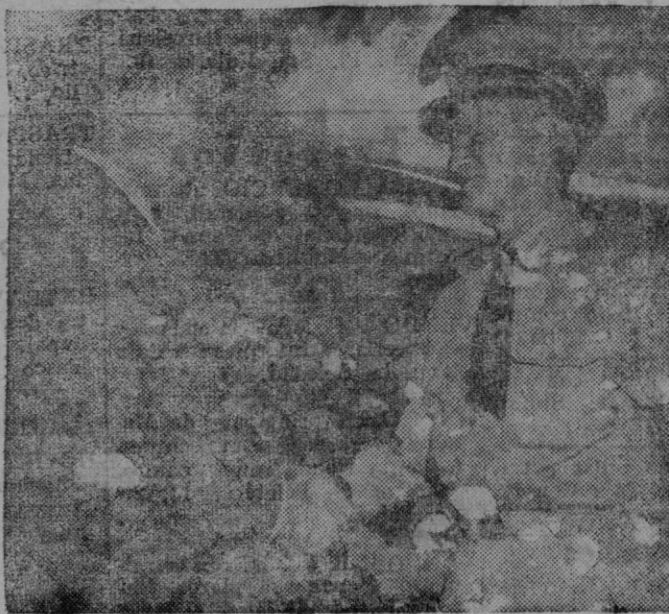
PERSONALIDADES NORTEAMERICANAS. — Donald M. Nelson, representante personal del Presidente Roosevelt ante el Gobierno de Chungking es saludado por el almirante Nimitz en Pearl Harbour durante un viaje del primer día a los Estados Unidos.