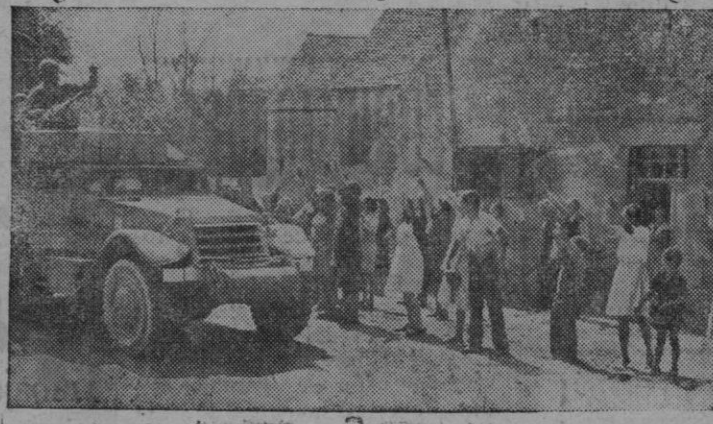
LOS FRANCESES ACLAMAN A SUS TROPAS.— Ciudadanos franceses acuden a saludar a la 2.ª División Blindada Francesa, a su paso un a población de Francia.