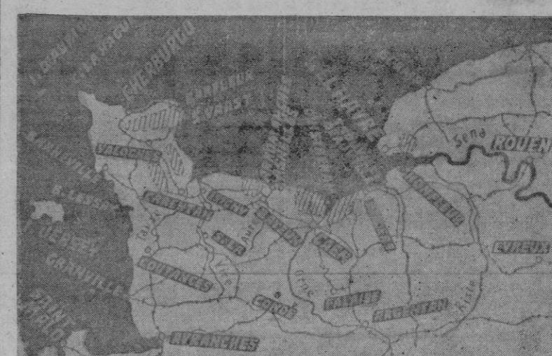
La Francia nordoccidental, don de se desarrollan actualmente los acontecimientos militares es del asalto a Europa

«La nueva tarea es, pues, consolidar las posiciones conquistadas en el desembarco».