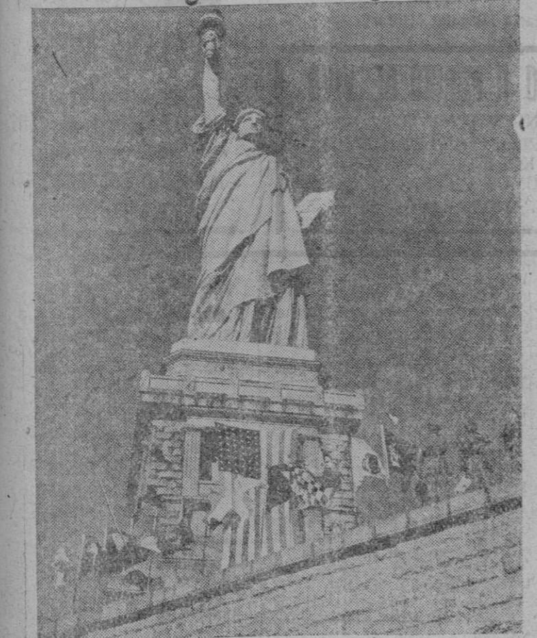
EL SIMBOLO DE LA LIBERTAD.—La Estatua de la Libertad, que se eleva 105 metros sobre el Puerto de Nueva York, fue donada en 1886 por el pueblo francés a los EE. UU. para simbolizar la libertad por que lucharon gloriosamente ambas naciones. He aquí soldados norteamericanos saludando a la estatua mientras las banderas de las naciones unidas ondean al aire.

la estabilidad europea que serán discutidos ulteriormente. La reunión de esta mañana fue presidida por Churchill.