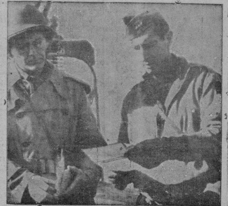
MANDOS ALIADOS.—El Teniente General Clark, leyendo los despachos del desarrollo de las operaciones aliadas en la costa accidental de Italia.