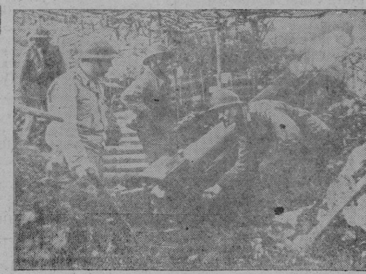
EN FRENTE ITALIANO.—Soldados de una unidad francesa del 5.º Ejército Aliado en Italia disparando contra las líneas alemanas con un mortero del 105.

Gobiernos neutrales en la capital inglesa. ¿Cuáles son las razones que han movido al primer ministro británico a no diferenciar a los representantes de las naciones unidas de los demás países. Nadie puede decirlo por el momento; mientras tanto las comunicaciones entre las diferentes Misiones extranjeras y sus respectivos Gobiernos continúan prácticamente interrumpidas, aquellas sin recibir respuesta a las consultas que se hicieron en la noche del lunes pasado, cuando se dió a conocer el aislamiento voluntario y casi absoluto de este país en la antevíspera de la invasión. Resulta de esta nueva situación que los representantes de ciertos países aliados que el martes fueron visitados por el subsecretario de Estado norteamericano Ward Stettinius con quien sus diferentes interlocutores celebraron conversaciones a las que se concede gran importancia, se encuentran en la imposibilidad de dar a conocer a las Cancillerías el resultado de las entrevistas sostenidas con el enviado norteamericano.