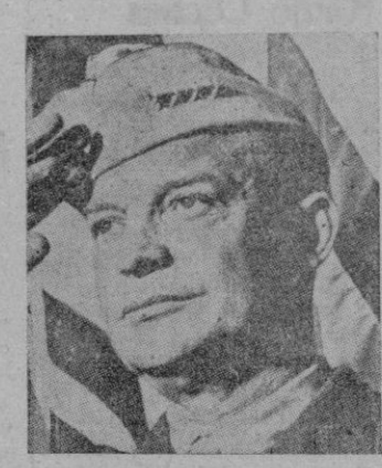
El general Eisenhower, jefe de los Ejércitos que desde Inglaterra saltarán sobre el Continente.