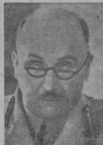
El general Wilson pasa a mandar todas las fuerzas aliadas del Mediterráneo.

El acto terminó con el desfilé de los reclutas ante el soberano Pontífice.—Efe.