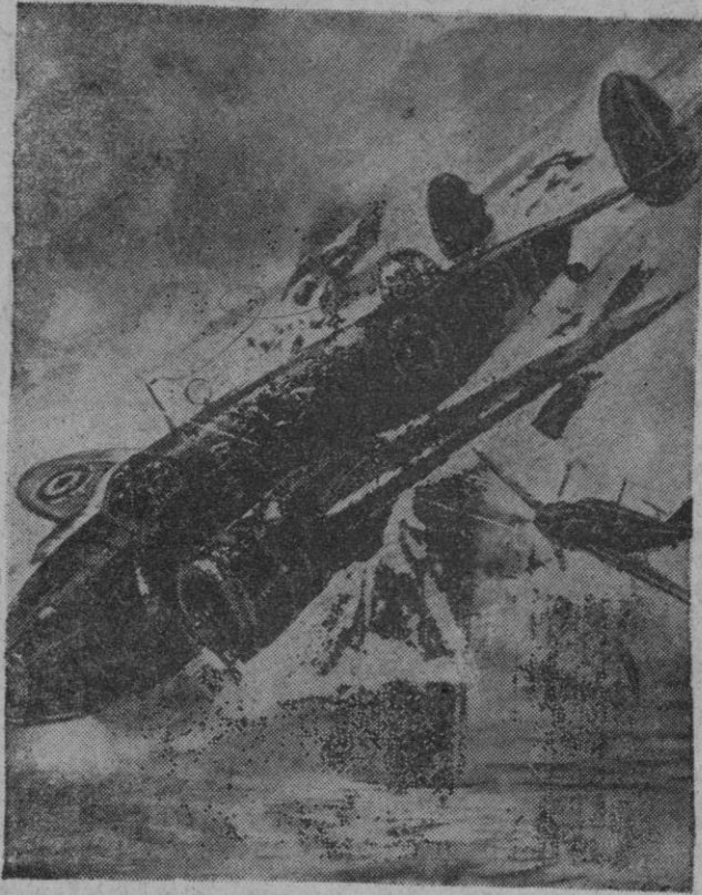
¡GUERRA DEL AIRE!—1939, 1940, 1941... tres años que marcan una fase en el arte de guerra. Miles y miles de veces esta fantasía de un dibujante al trazar el instante de ser abatido un avión se ha visto convertida en realidad.

Para los que pretenden de adivinos queda esa cosa de hacer suposiciones, cuanto a los hechos. Los grandes acontecimientos de la Historia del Mundo tienen el campo preparado en este año comenzado. Ahora, el tiempo decidirá.