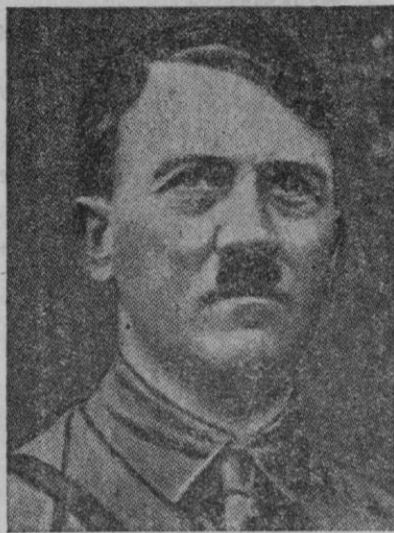
El Führer alemán

pre, un recuerdo que para la historia de Francia no ha constituido nunca una página de gloria, pero para el pueblo alemán ha constituido la más profunda vergüenza de todos los tiempos.