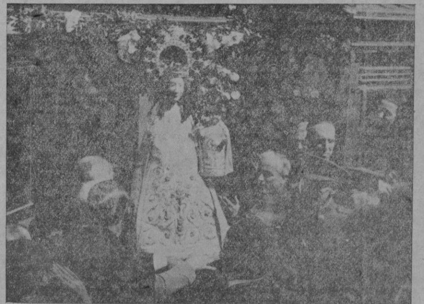
Nuestra Señora de San Salvador de Artá