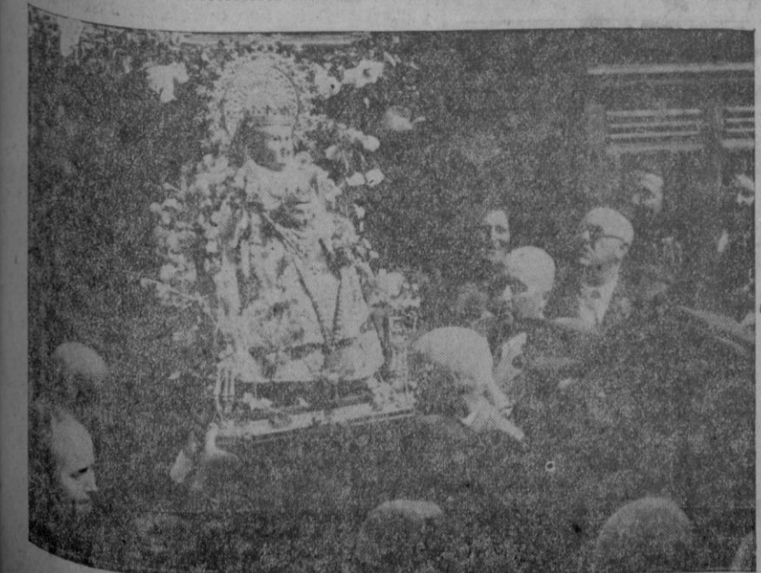
La Virgen de Bonany