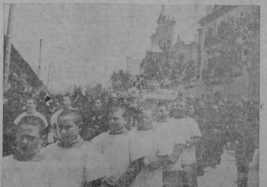
La Virgen de Lluch y su escolanía