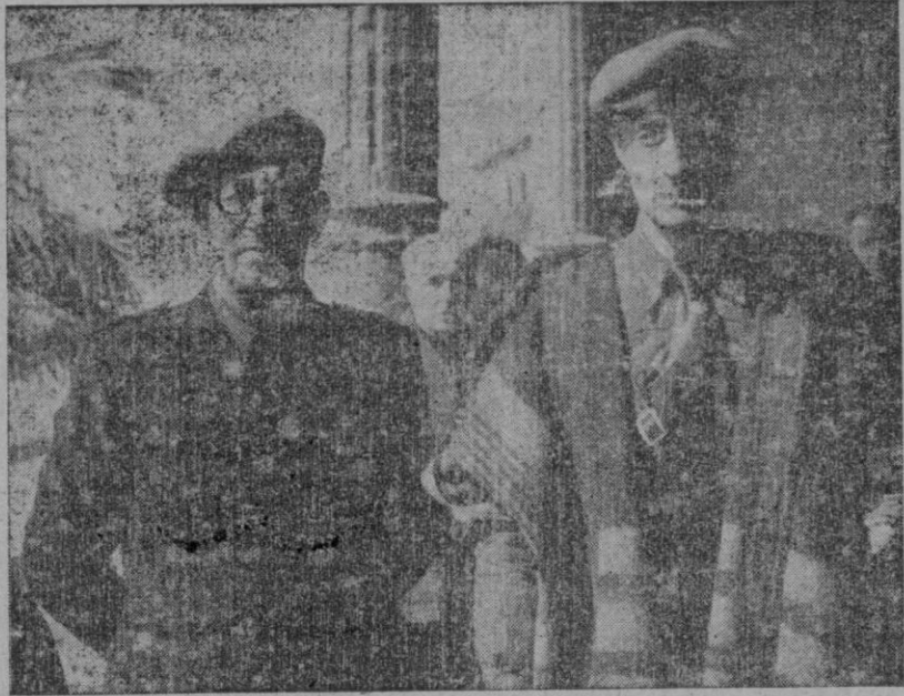
Miguel Primo de Rivera acompañado del camarada Boloqui