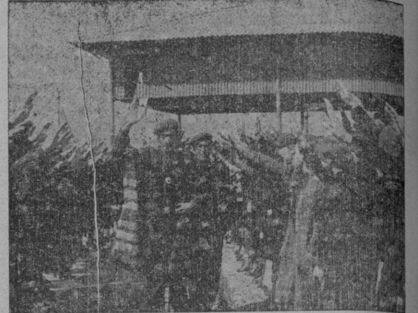
Miguel Primo de Rivera a su llegada a Palma saludando brazo en alto