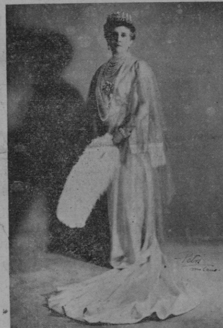
S. M. la Reina de Italia y Emperatriz de Etiopía

Si todo el valor de un hombre se mide por el grado de fidelidad con que ha cumplido la misión que Dios le ha señalado en la vida terrenal, no hay duda que la personalidad de Víctor