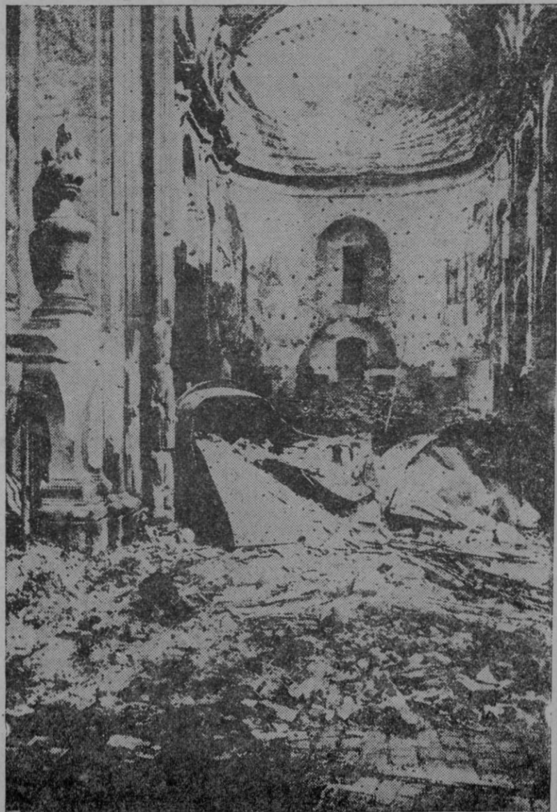
Estado en que dejaron el abside de la iglesia de Belén de Barcelona las huestes rojas. Nueva prueba de su vandalismo y de su vesánico furor