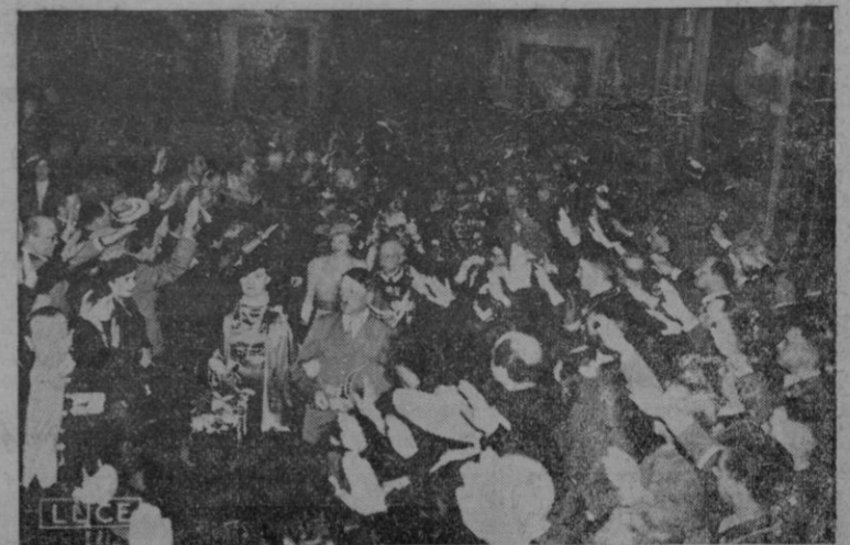
Roma. — El Gobernador de Roma ofrece una recepción en honor del Führer