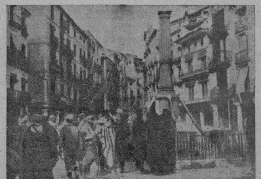
La plaza central de Teruel, llamada del Torico. La estatua en bronce, de misterioso origen, que remataba la columna, falta de ésta como verán los lectores. Nuestras fuerzas comentan el hecho pocos momentos después de entrar en Teruel

Mr. Barthélemy recuerda y comparte además unas palabras del Conde Grandi en el Comité de no intervención. La "insurrección", echada en cara a la nueva España como impedimento de su legitimidad, constituye el título de origen de "gran número de Estados y de regimenes que sacan incluso de ello un motivo de orgullo... F se da la paradoja de que algunos Estados, circunstancialmente olvidados de su propia historia, de su mismo nacimiento, han caído en la inferioridad de aplicar al Gobierno del General Franco el argumento "legalista" y anti-insurreccional que es la razón his-