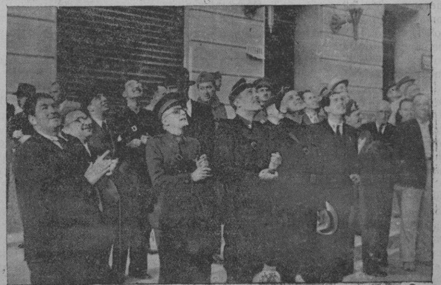
Las Autoridades en el momento de ser izada la Bandera en el nuevo Gobierno Civil. (Foto Ribas de Durán).