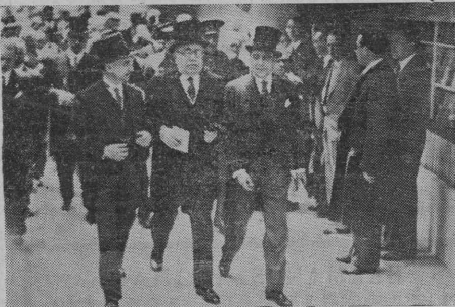
S. E. el Presidente de la República acompañado del Jefe del Gobierno y del Sr. Jiménez Asúa, inaugurando la feria del Libro que se celebra en Madrid.

que haya de hacerse para construir el Mercado encontrará la acogida franca y entusiasta que deseamos cuantos mirando al interés de la ciudad venimos interesándonos para que Palma sea dotada de un Mercado que responda a las necesidades de la población y a su importancia.