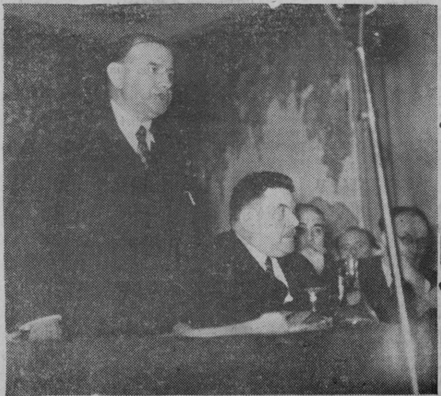
Mr. Deladier pronunciando su comentado discurso en la reunión celebrada por el partido radical socialista.