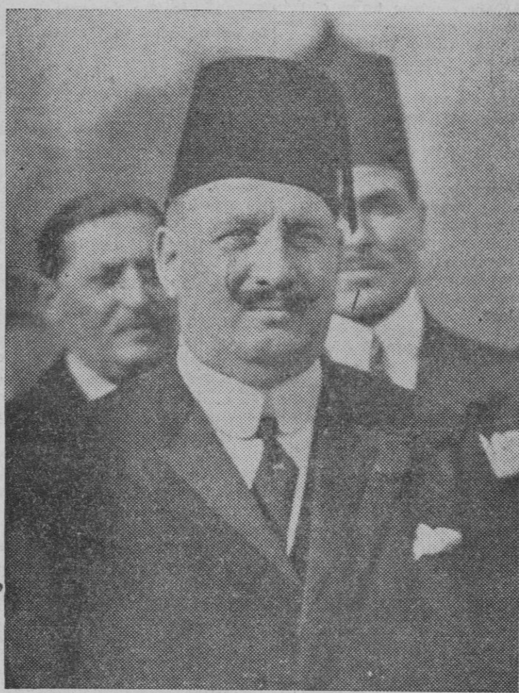
Reciente retrato del Rey Fuad de Egipto, fallecido anteayer.

Por ello vemos con satisfacción los acuerdos anoche tomados, y aplaudimos la decisión que muestra el Ayuntamiento, al cual sinceramente alentamos para que con toda decisión acometa la realización del proyecto.