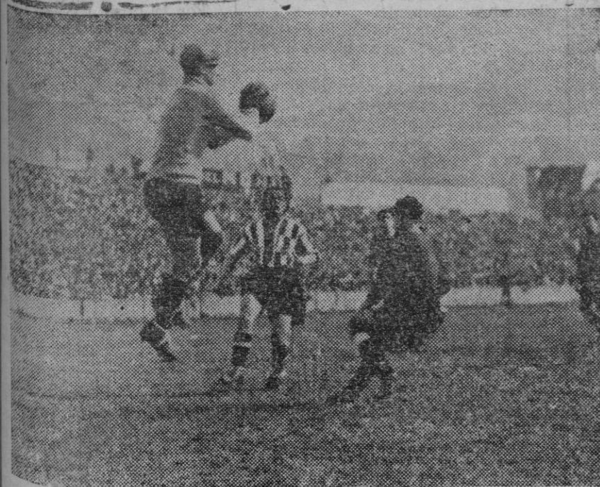
En el campo de San Mamés, lucharon el domingo los equipos Athletic, de Bilbao, y el Barcelona, ganando los primeros por 5 a 2.