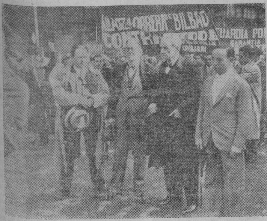
Los Concejales nacionalistas van con dirección al Ayuntamiento al ser repuestos, seguidos de una manifestación.