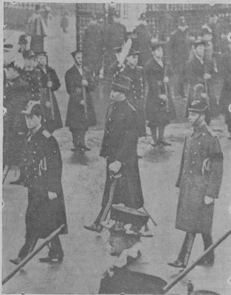
El nuevo Rey de Inglaterra Eduardo VIII, presidiendo el entierro de Jorge V.