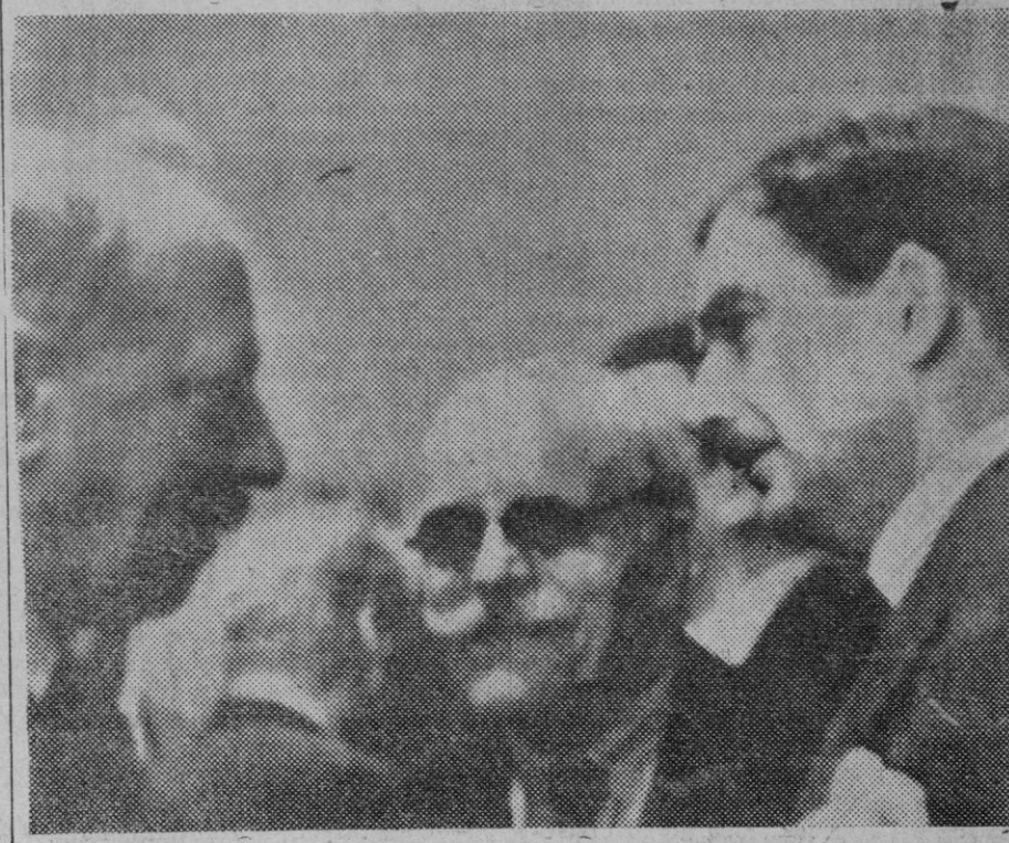
Mr. Eden, nuevo Ministro de Negocios Extranjeros de Inglaterra, conversando con los periodistas en los pasillos de la Sociedad de Naciones.