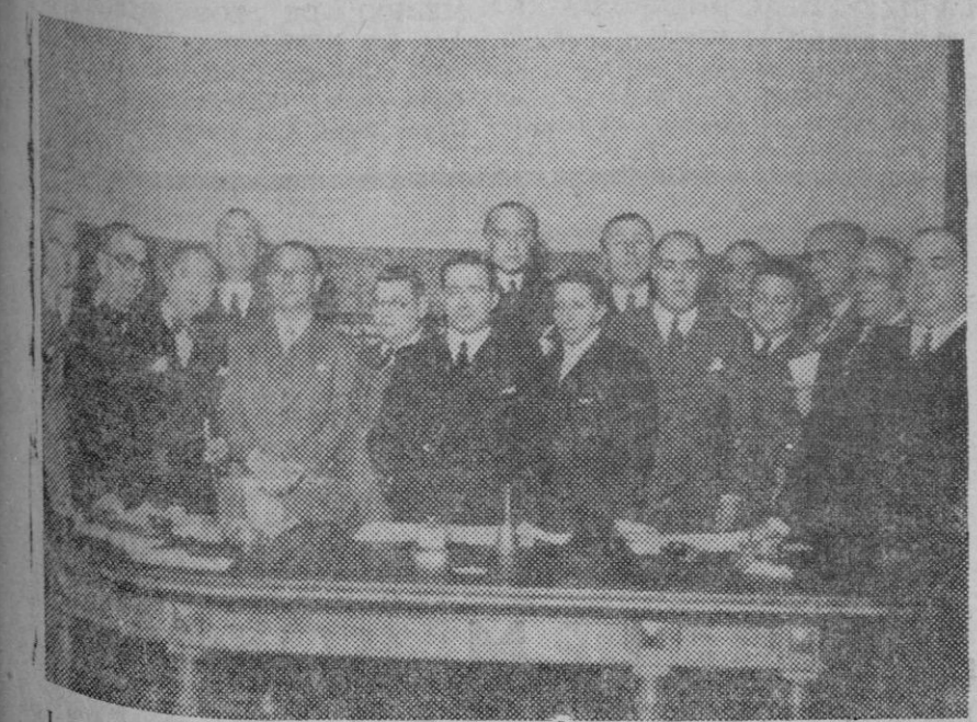
La Comisión parlamentaria que entiende en la cuestión del juego, al reunirse por primera vez.