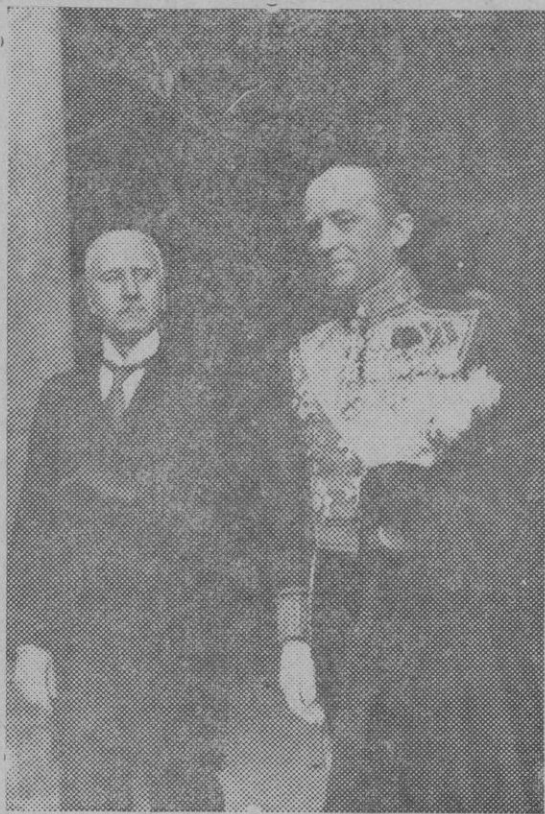
El nuevo Ministro de Dinamarca en Madrid, Mr. Franz Christoffer, al salir del Palacio de presentar sus credenciales al Presidente de la República.