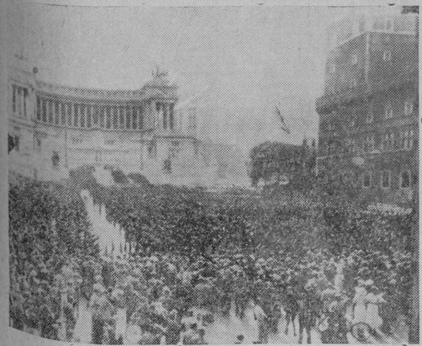
Aspecto de la plaza del Imperio, de Roma, al llegar la manifestación de júbilo por la toma de Adua. El lugar indicado por la flecha es el que ocupaba Mussolini para presenciar el paso de los manifestantes.