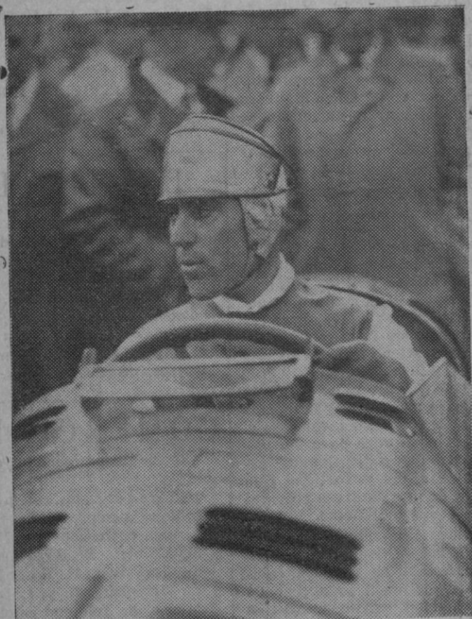
Se ha disputado la gran prueba automovilista «III Gran Premio de Niiza». Siendo la distancia a cubrir de 321'400 kiló metros. Resultó vencedor Nuvolari que cubrió la distancia en 3 horas 4 m. 59 7/10 seg. consiguiendo un medio de 104, 241. Nuvolari en su coche con el cual ganó la carrera.