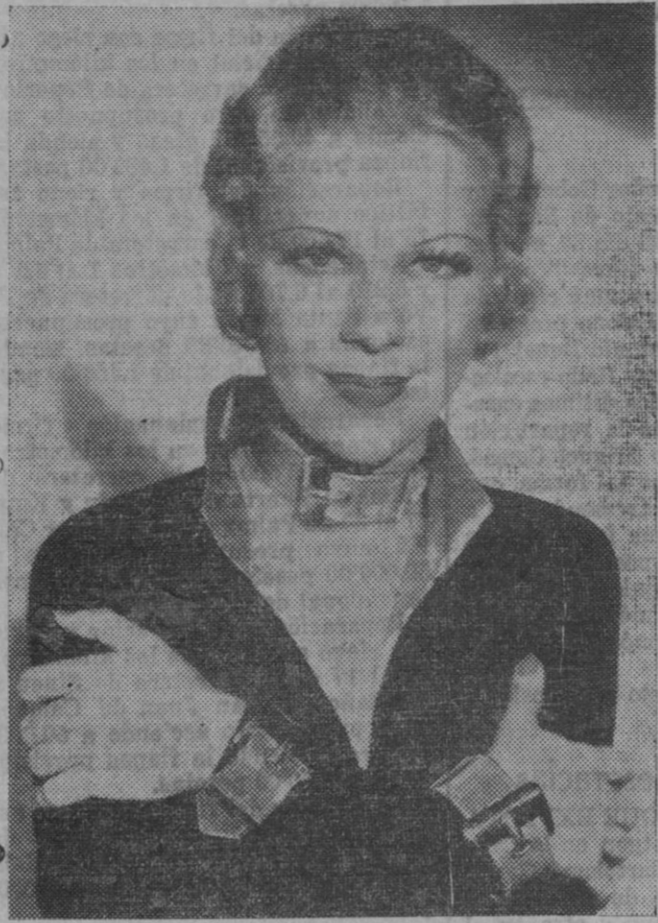
La encantadora estrella de la pantalla 'americana' Glenda Farrell, llevando un collar al igual que el de los perros, hecho con malla de oro y sus cadenas a las muñecas haciendo juego con el collar.

CHATA DE ALMENDRAS. — Tronchales, las almendras molla,