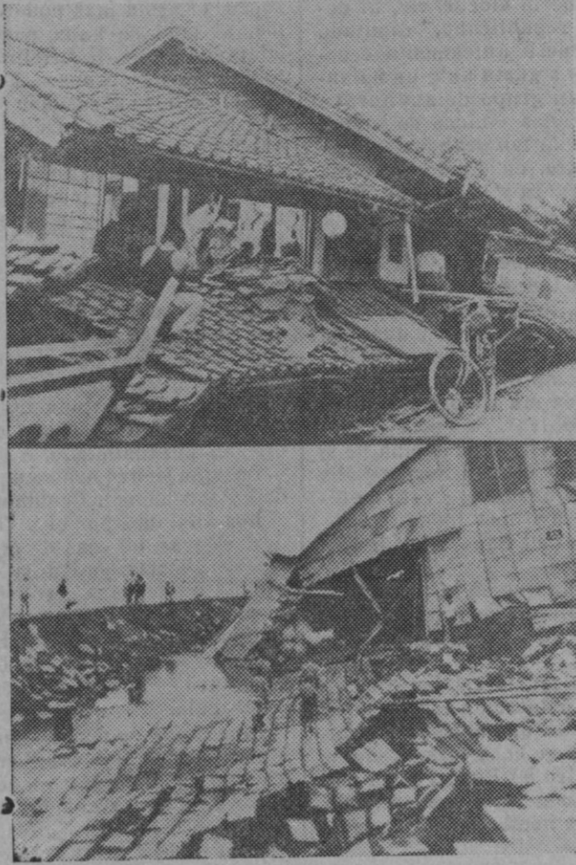
En el Japón se han registrado nuevamente sacudidas sísmicas quedando destruidos varios pueblos y muchas familias han quedado sin hogar. Arriba, habitantes de Shisouka, buscando en medio de los escombros sus objetos de valor. Abajo, muelle destruido y empedrado abierto forzosamente.

Digna de loa es pues esta obra por el fin social que persigue; y digna de loa es también la intención de comenzar pronto la construcción de esta barriada a fin de poder dar con esta empresa un poco más de actividad a la vida económica de la población, harto precisada de estos impulsos.