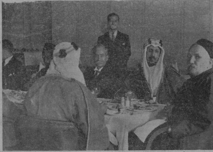
S. A. R. el Emir Sand, príncipe heredero de Arabia, visita la Isla de Jagee en Hampton Court durante su estancia en Inglaterra. El príncipe junto con el Basil Pasha, jefe de los beduinos de Arabia.

¿Cuándo se hará algo positivo para dar solución a este problema?