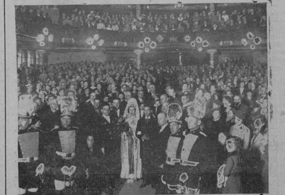
Con gran brillantez se celebró el domingo por la tarde en el Palau de la Música Catalana la tradicional fiesta de los Juegos Florales. La reina de la fiesta con el poeta ganador de la flor natural al subir a la presidencia del acto.

Mas del Tesoro del Nizan, concretamente, nos ocuparemos otro día. HARRY STAFORD Calcuta, Abril 1935. (Prohibida la reproducción).