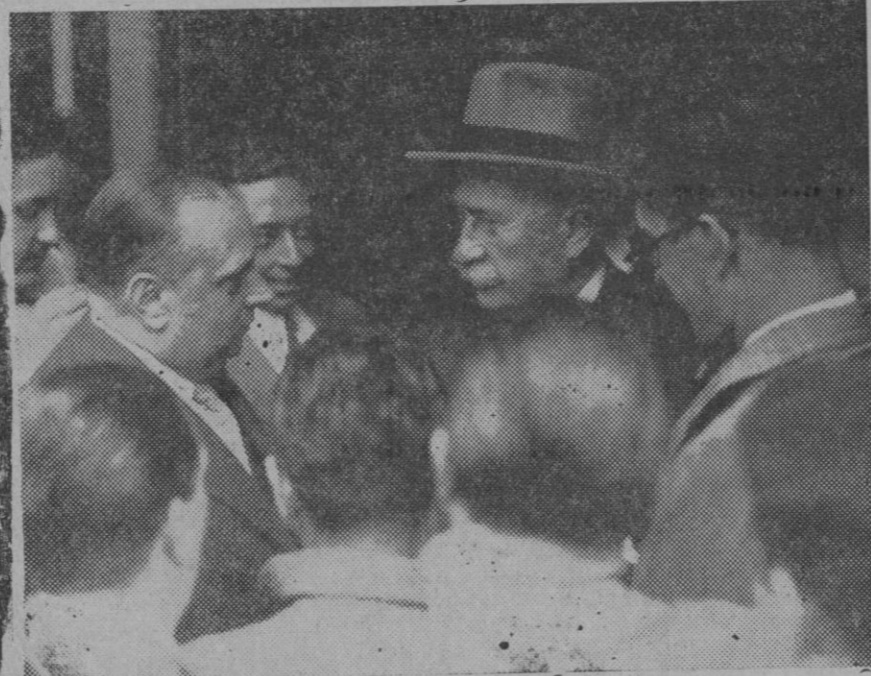
El Sr. Lerroux al salir de casa del Presidente de la República, después de presentar su dimisión. (Express Foto).

Colegio Provincial de Médicos, deseando que alrededor de esta cuestión se forme un favorable ambiente que estimule a la Corporación Municipal a emprender aquel proyecto que ya en diversas ocasiones ha tratado de llevar a cabo.