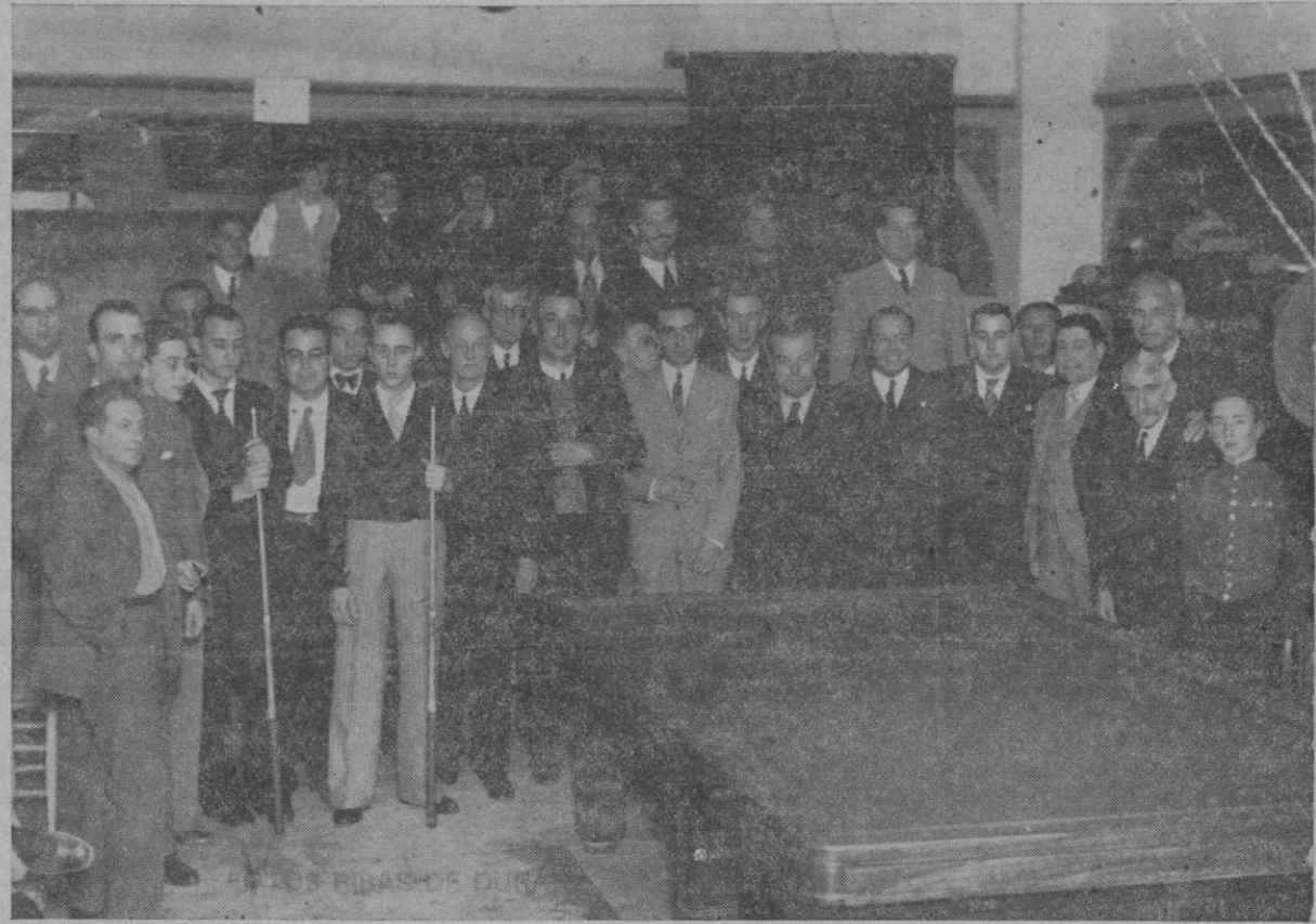
Grupo de jugadores que toman parte en el campeonato de España de Billar, que ayer dió principio en el Café Born.

Bacher 21-Pou 32. PREMIO MONTAÑA: Barral 42, Molinar 30, Amberg 29.