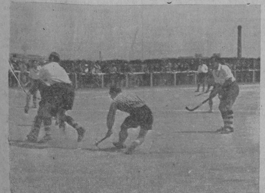
En el Campo del Polo y ante bastante concurrencia se jugó el domingo por la mañana el partido final del Campeonato de España de Hockey con los equipos Club de Campo de Madrid y el Polo de Cataluña, con un resultado de uno a favor del Club de Campo.