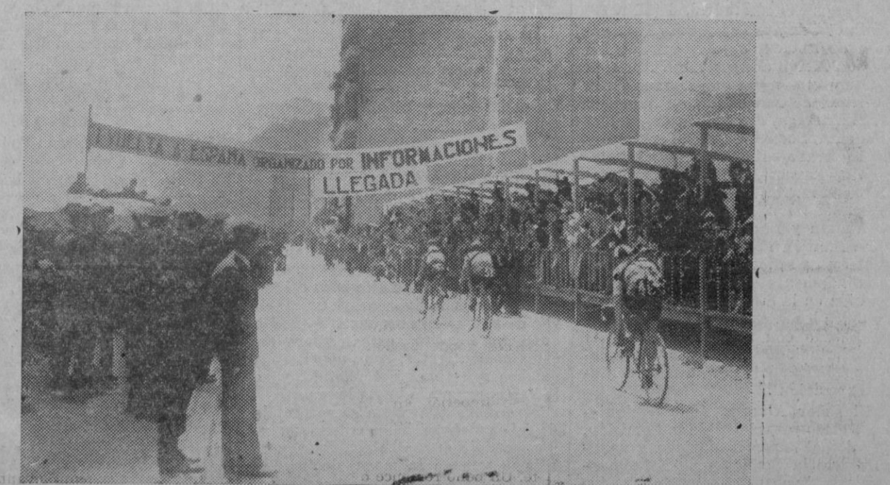
Con gran brillantez se celebra la primera vuelta ciclista a España. Los corredores a la llegada de la etapa de Bilbao.

De José L. Riera del Corp-Mari, no es necesario recordar, cuanto de él, en ocasiones diversas hemos dicho. Es en la actualidad el más veloz en los 100, 200 y 400 m. libres, ahora sí que también hemos de decir que sus «dirigentes» han de procurar «cuidarles» pero mucho y no dejárselo llevar por sus ímpetus juveniles afanosos de laureles, en ocasiones inconquistables, dejándo-