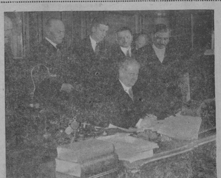
El pasado jueves por la tarde tuvo lugar en el Quai D'Orsay (París) la firma del pacto entre Francia y la Rusia Soviética. M. Potemkin, embajador de la U. R. S. S. en Francia firmando el pacto, detrás de él M. Laval.