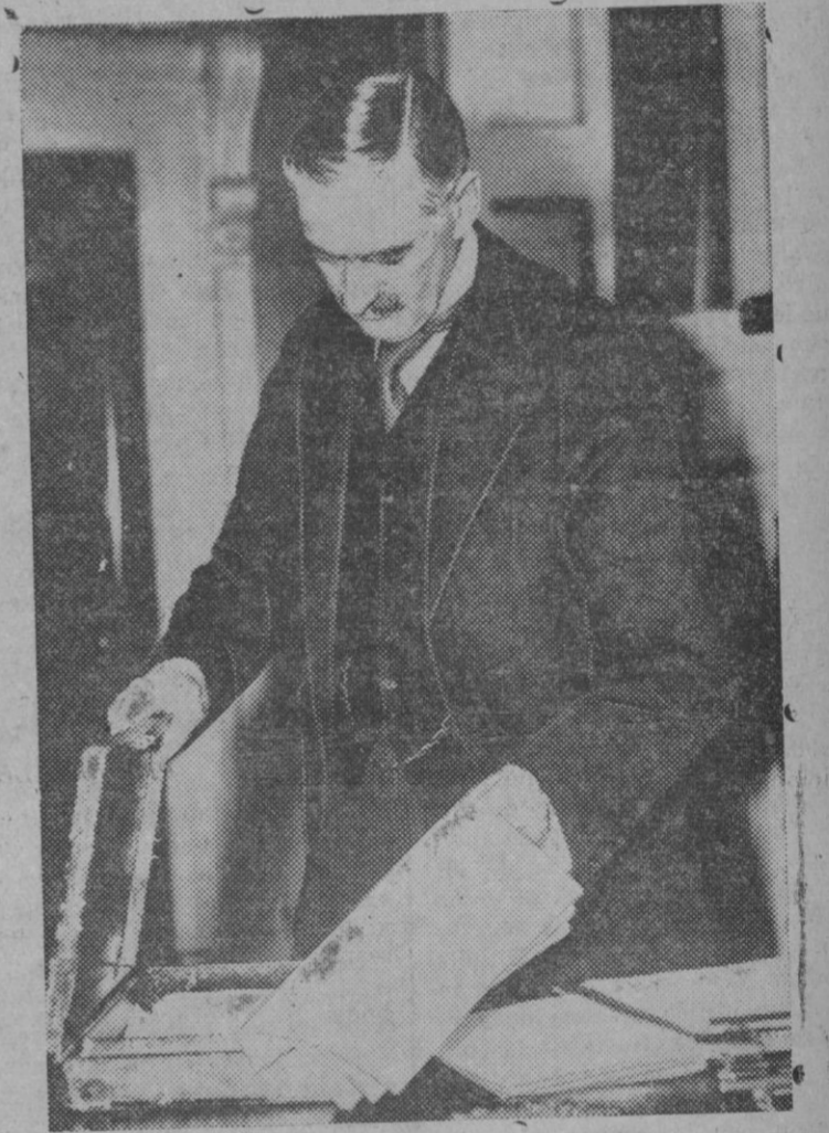
El eminente político inglés Mr. Neville Chamberlain, Canciller de Hacienda en el gobierno británico, da los últimos toques al balance de las finanzas de aquel país. El balance es esperado con gran interés, y se cree que sus secretos sensacionales serán puestos de manifiesto en plena sesión de la Cámara de los Comunes.