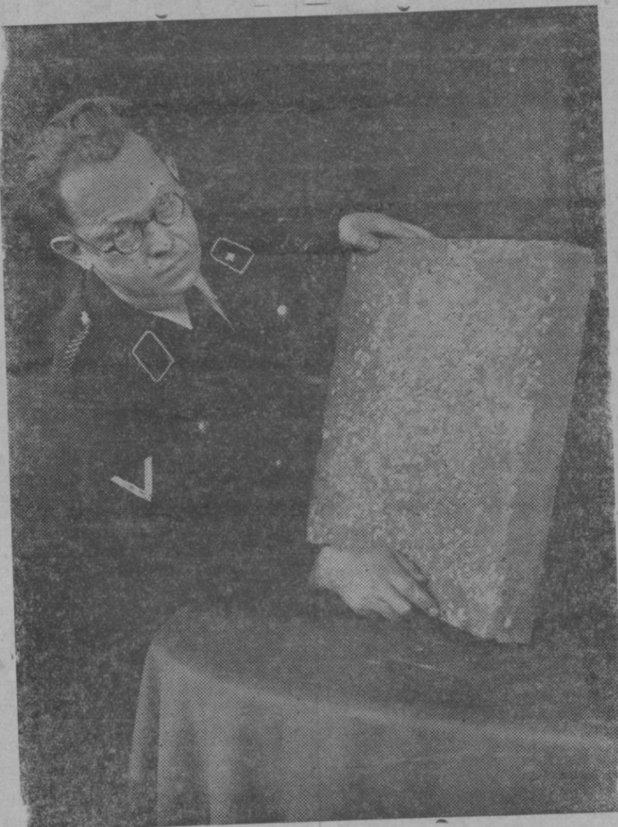
El químico de Berlín Aertz ha descubierto la manera de fabricar un excelente ladrillo para la construcción a base de basura, éste tiene la ventaja de resultar considerablemente más barato.