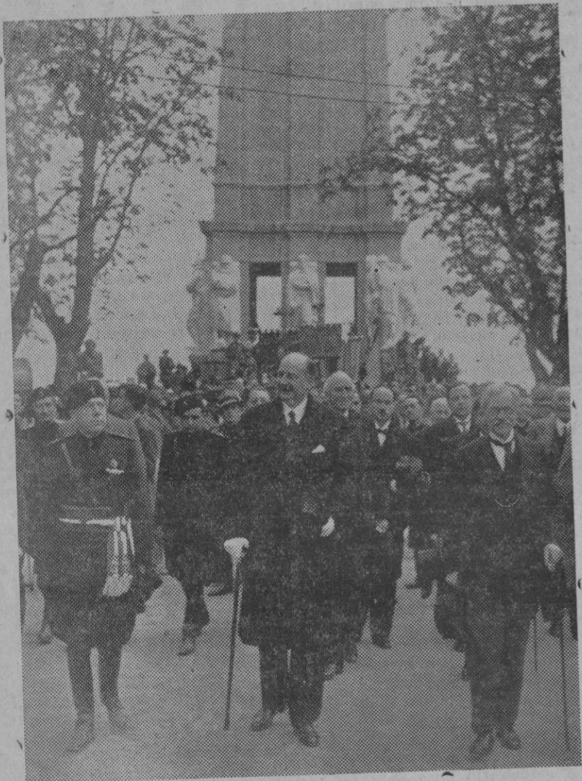
Las delegaciones extranjeras visitaron el monumento al general Cadorna en Pallanza. M. Flandin y M. Mac Donald seguidos por Sir John Simon. (Foto transportada en avión)