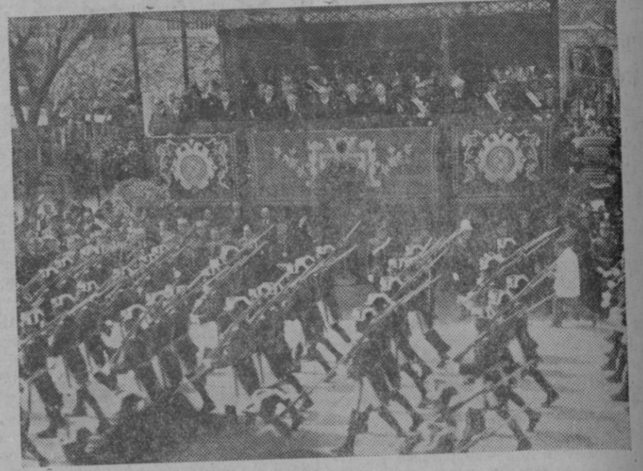
La Guardia Civil de Infantería desfilando ante la tribuna presidencial, con motivo del aniversario de la República.