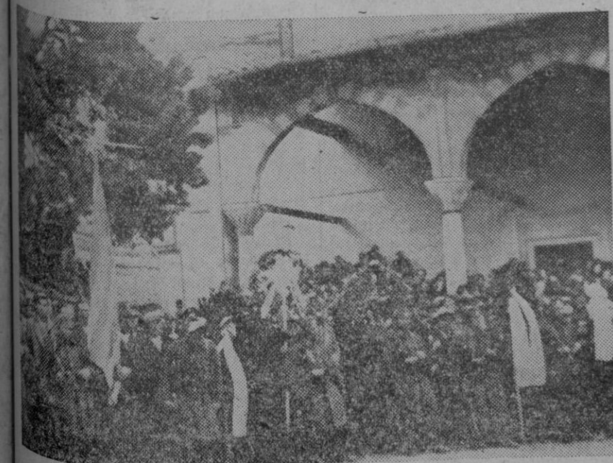
Las fuerzas gubernamentales han logrado finalmente recuperar a los desertores que estaban en poder de los rebeldes. Exequias del Sargento Skemtzos delante de la catedral de San Démétrio, en Salonica.