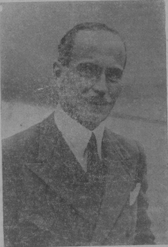
El aviador inglés C. W. Scott vencedor de la carrera Londres-Australia, al que le ha sido otorgado el trofeo internacional de aviación «Harmon 1934».

¿No podría el Ayuntamiento hacerse eco de las quejas justísimas que contra ello formula el vecindario?