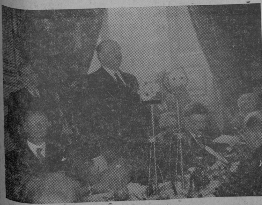
M. P. E. Flandin, ha asistido a un banquete celebrado en su honor con motivo de la feria de Lyon. Aquí vemos a M. Flandin durante su discurso.