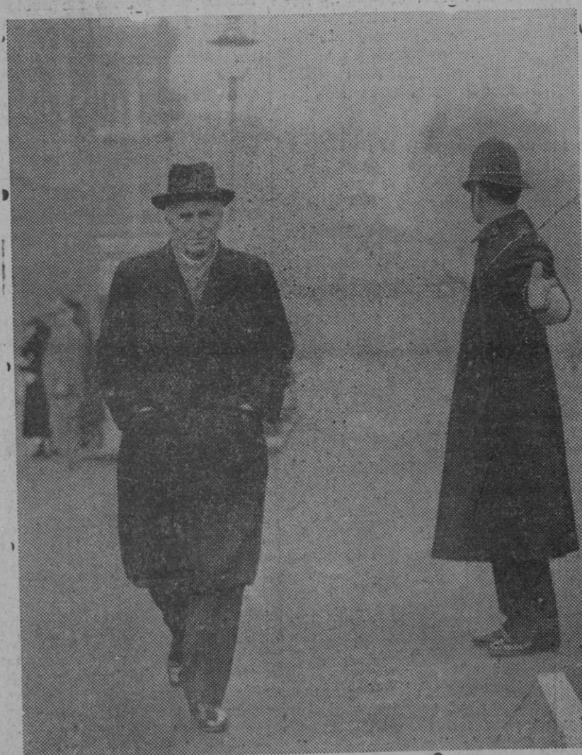
Sir John Simon, la más preeminente figura política inglesa en estos momentos, que como se sabe efectuará en breve un viaje a Moscú, quedando en suspenso el que tenía que efectuar a Berlín. La actuación de Sir John Simon tiene gran importancia para la paz de Europa.

Pero, ellos han insistido. No se puede consentir que a una persona tan auténticamente modesta como yo, que primero insinúa los homenajes, y luego se arrepiente y los rechaza, le falte uno, y de los mas entusiastas. Porque ¿no se le ha dado otro recientemente a un funcionario, solo