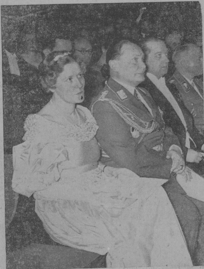
Un comunicado de la prensa alemana nos hace saber el próximo casamiento del General Göring con la conocida artista del teatro nacional alemán Srta. Emmy Sonnemann. Una reciente fotografía del General Göring y su futura esposa, durante una representación en el Teatro 'la Comedia de Berlín. (Express Foto).

pedita dicha plaza, ¿porqué no estudia el Ayuntamiento la manera de dar a esos vendedores un lugar adecuado y conveniente a fin de no privar, como de hecho les ha privado, de su modesto negocio?