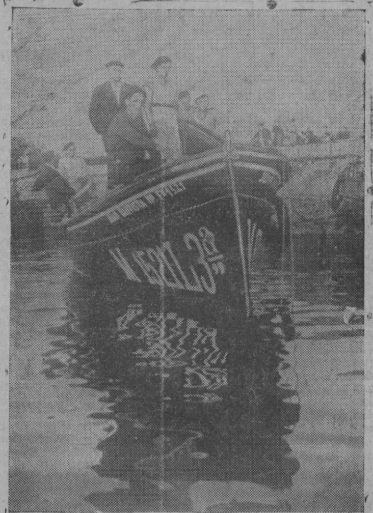
UNA TRAGEDIA PESQUERA EN MUNDACA (Vizcaya). — La lancha motora «Juan Bautistas de Mundaca» que habiendo salido a la mar quedó destrozada por la explosión del motor muriendo todos sus tripulantes.

Así se comprende que desde los primeros momentos alcanzase la lucha proporciones insospechadas. Todos