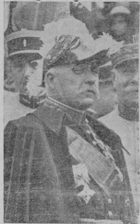
FRANCIA.— El General Maurin, nuevo ministro de la Guerra, en el nuevo gobierno de trece de Mr. Flandin.