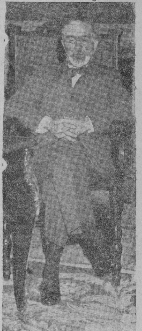
Mr. BARTHOU, ministro de Negocios Extranjeros, una de las más brillantes figuras de la política francesa, muerto en el atentado contra el Rey Alejandro de Yugoslavia.

El Comité organizador de la Exposición ha acordado que los billetes para la misma costarán cien francos por persona. Con este billete se tendrá derecho a entrar en el recinto cuatro veces, una reducción en el precio de todas las atracciones de la Exposición una participación en una tómbola y precios reducidos en los tranvías y autobuses que vayan a la Feria.