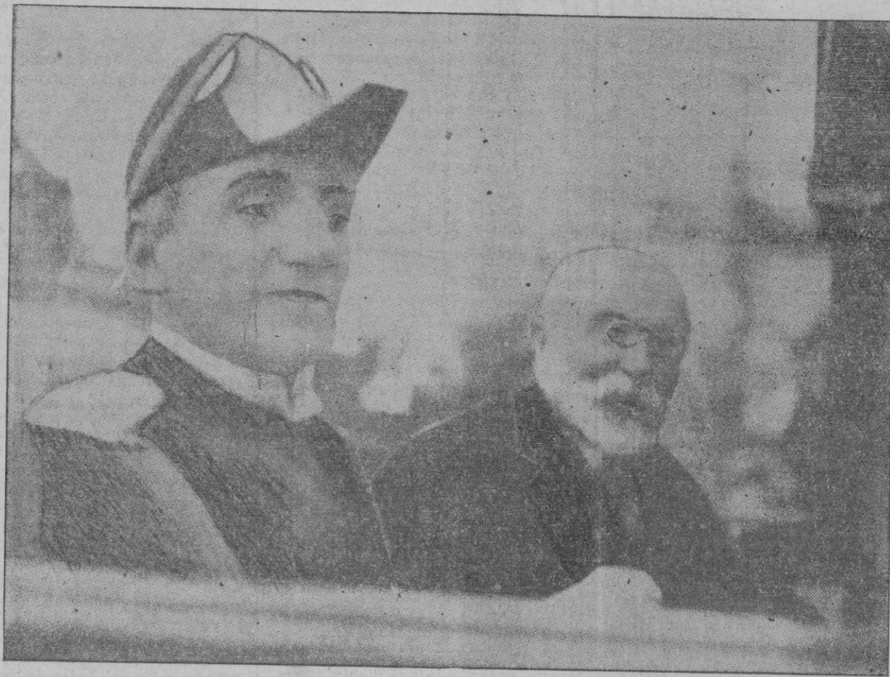
EL ASESINATO DEL REY ALEJANDRO DE YUGOESLAVIA. — El Rey y el Ministro de Negocios Extranjeros de Francia Mr. Barthou en el coche que tomaron al desembarcar aquél en Marsella. — Los rostros sonrientes de ambos personajes no permiten presagiar el drama que breves momentos después había de costarles la vida.

Al hacer la afirmación de estos sentimientos, frente al execrable crimen, deploramos la pérdida de esas vidas que tan útiles eran a Europa, y que han sido cruelmente segadas cuando más eficaces podían ser, cuando se empeñaban precisamente en afirmar aquella política en Europa.