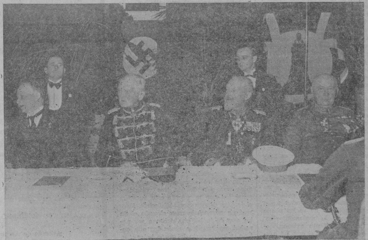
REUNION DE VETERANOS. — En Heringsdorf, población del Báltico, se ha celebrado una gran reunión de altos jefes de la Vieja armada alemana, que ha sido presidida por el mariscal de Campo Von Mackensen, que aparece en nuestra fotografía presidiendo la mesa de honor.