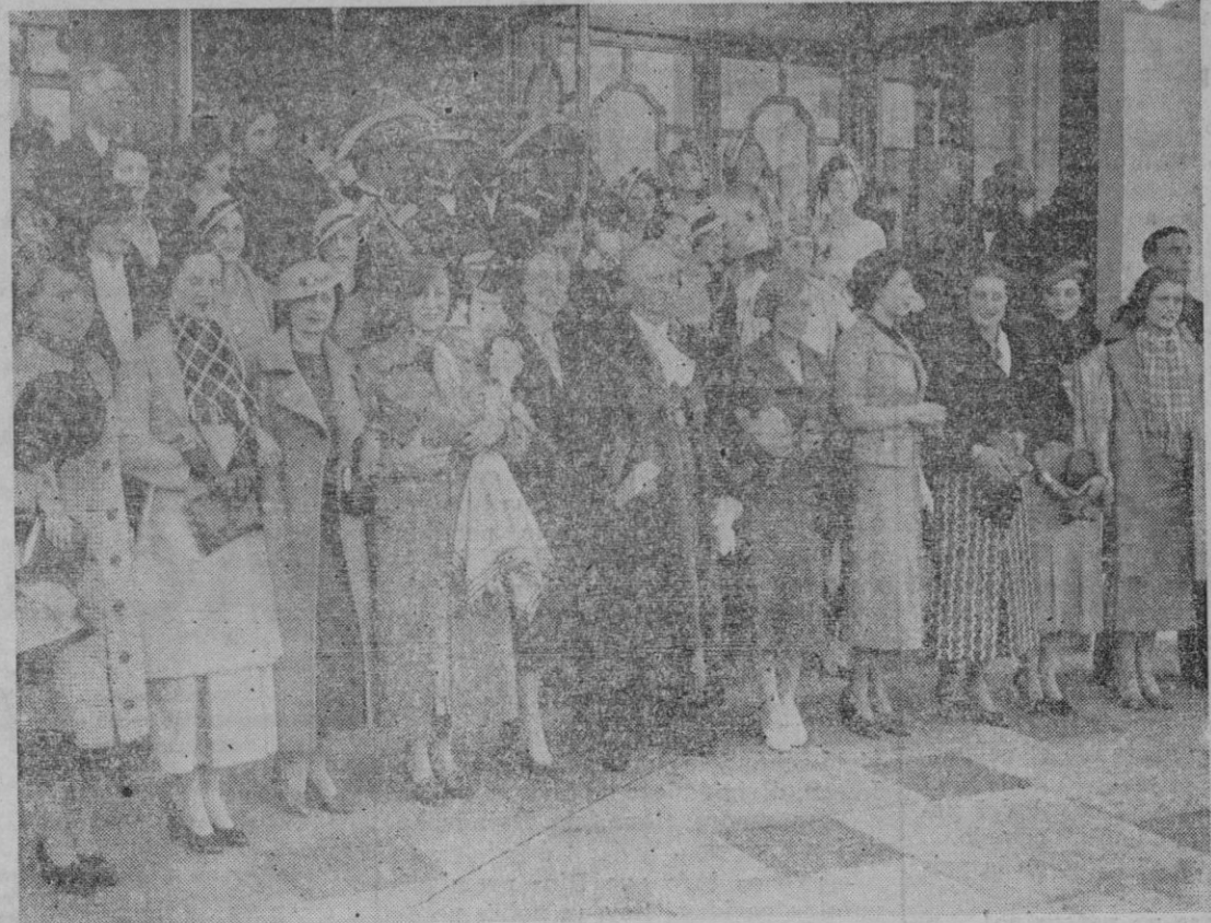
LAS REINAS DE LA BELLEZA EUROPEA EN HASTINGS.— Las reinas de la belleza, de todos los países de Europa, han llegado a la famosa playa de Hastings, donde han sido recibidas solemnemente por el Alcalde. Ha sido ya elegida Miss Europa, siendo proclamada «Miss Finlandia»

La oscilación desfavorable de los valores ferroviarios, si no producida por esta alarma, cuando menos coincidente con ella, dice bien claro lo delicado que es entregar prematuramente cifras y afirmaciones al mercado, donde se transforman en seguida en materia de especulación burlesca. Pero con la precaución que esta delicada materia