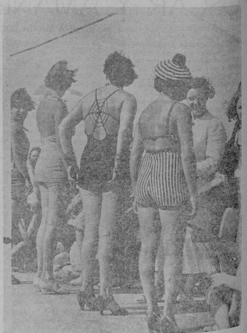
LA ULTIMA EXHIBICION DE TRAJES DE BAÑO. Margate, la famosa playa, famosa por sus concursos de belleza, acaba de ser escenario de una nueva competición. Se trata esta vez de trajes de baño, para obtener el máximo beneficio del sol, del aire y del agua, lo que equivale a decir, trajes de baño con la menor cantidad de traje posible. Aquí vemos algunos de los modelos presentados.