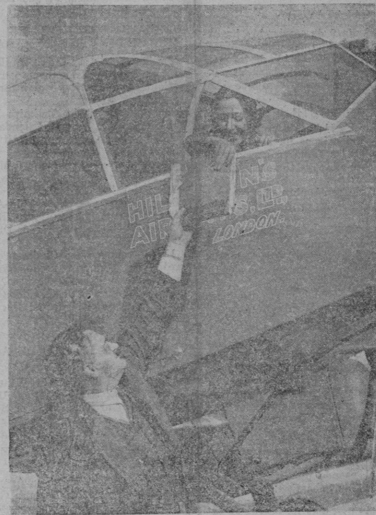
Any Mollison, la famosa aviadora, trabaja de piloto en la línea Inglaterra - Francia. Any Mollison, la famosa aviadora que hizo sola el vuelo a Australia, está conduciendo aviones comerciales a través del canal. Es la primera vez que una mujer ejerce este cargo. Por lo visto se trata de entrenamiento para la gran Carrera Inglaterra-Australia, que hay en perspectiva.

Lo que aquí nos interesa — dice este autor — no es el tiempo calculable; es más bien el tiempo disolviéndose en la tradición y en la profecía. La Torre de Babel, el Jardín del Edén, tienen reproducciones retrospectivas que se pierden en el pasado. Podemos sondear el pozo del tiempo hasta sus profundidades sin encontrar el fondo.