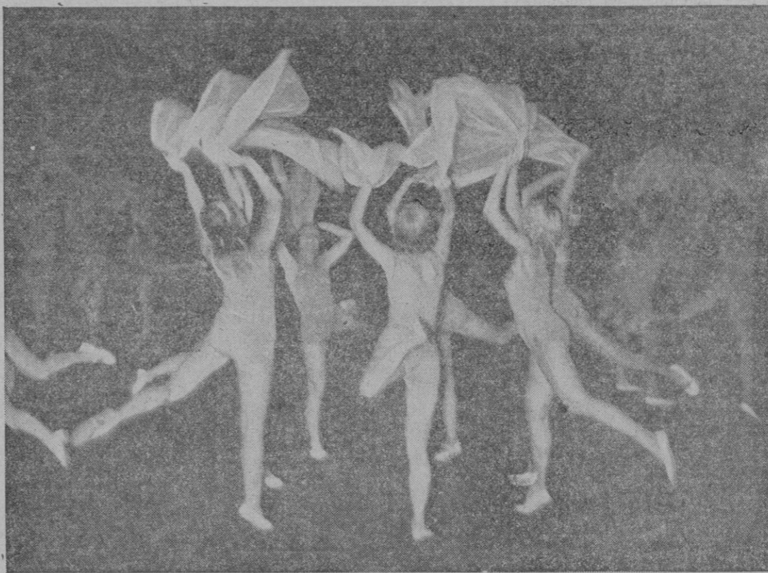
DANZAS RITMICAS. — En la exposición de flores que actualmente tiene lugar en la torre de la Radio en Kaiserdam (Berlín), la escuela de danzas clásicas «Egon Molkow» ha hecho exhibiciones particularmente artísticas. Un momento de la «Sinfonía de danzas»

La Banda Republicana dará tres conciertos sinfónicos en el teatro romano las noches del 4, 6 y 8 de septiembre, entremezclados de danzas clásicas.