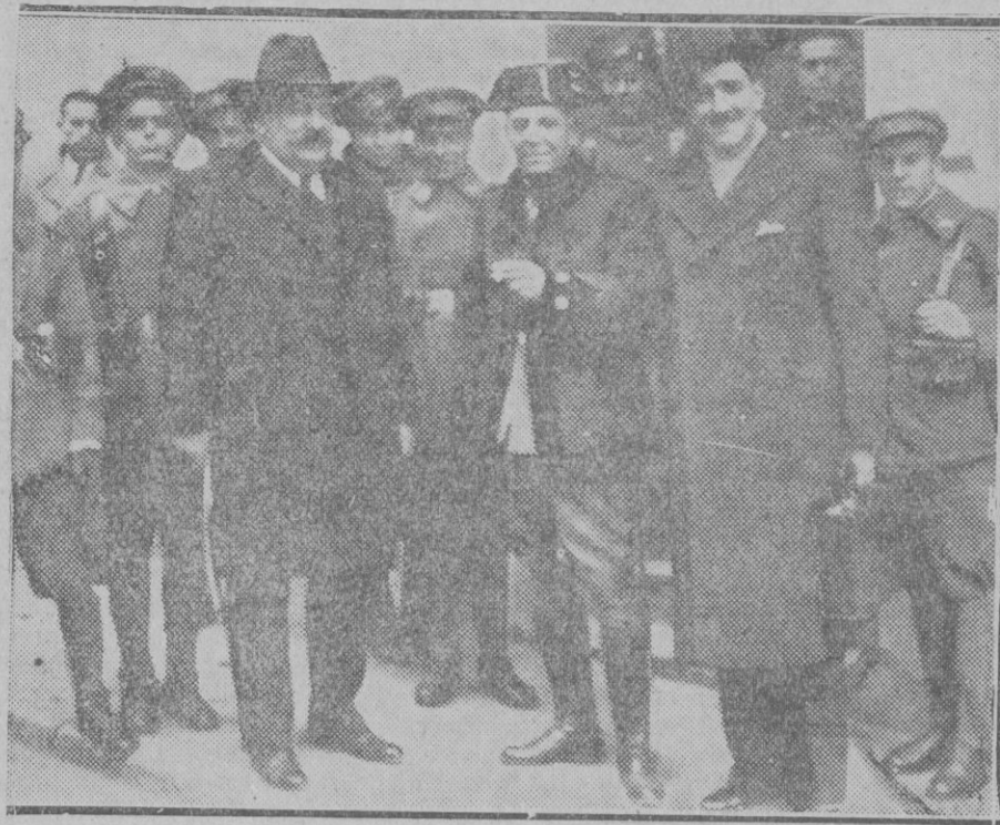
MADRID. — Grupo de oficiales militares al ser puestos en libertad después de la vista por los sucesos del 10 de Agosto

Como hemos hecho en las anteriores ocasiones que se ha tratado de esta cuestión, hemos de adherirnos a la petición que en dicho escrito se formula, deseando que el poder público la atienda salvando a esta industria del estado agobioso que viene atravesando.