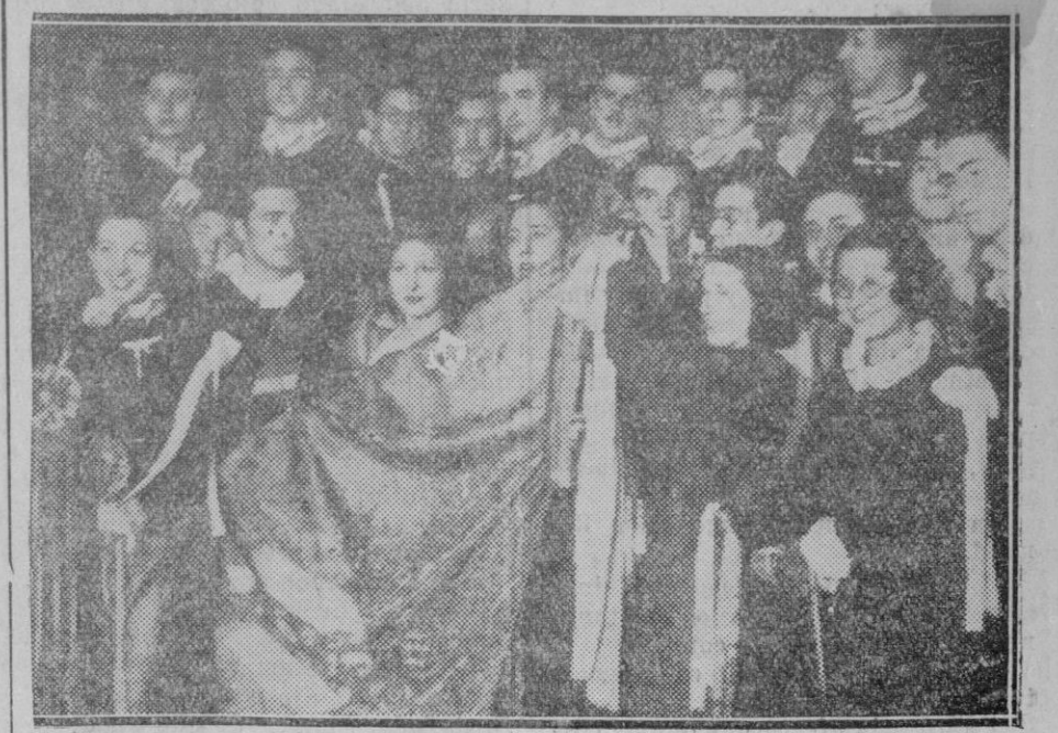
MADRID. — La sociedad «El retablo de maese Pedro» impone una corbata al estudiantado de la tuna madrileña

He aquí el caso de Inglaterra. En 1931 los ingresos bajaron en más de diez y seis millones de libras, cuatrocientos millones de pesetas-oro.— Se ha remediado el daño con la electrificación de las líneas, con la unificación de los transportes por rail y por carretera y con el auxilio del Estado, pero también con el abaratamiento de las tarifas. El "penny a mile", creado en mayo para la temporada veraniega y prorrogado luego por un año, llevó a las líneas férreas millones de viajeros. El "penny a mile", es caro aun si se compara con el billete especial de excursiones, en re-