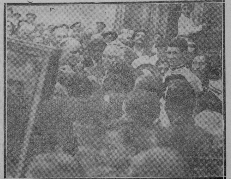
El obispo de Victoria Director de Música es aclamado a la salida de la iglesia de San Antón, por el público.

Desde un punto de vista, puramente materialista y económico, hay al-