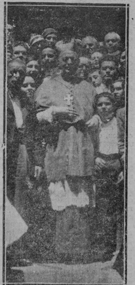
MADRID.— El Nuncio de Su Santidad monseñor Tedeschini al salir de la basílica Pontificia después de la solemnidad religiosa celebrada con motivo de la fiesta de San Pedro y San Pablo