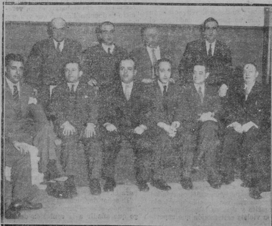
El conflicto patronal en Madrid.— Grupo de los Patrones que fueron detenidos y a quienes se ha puesto nuevamente en libertad.