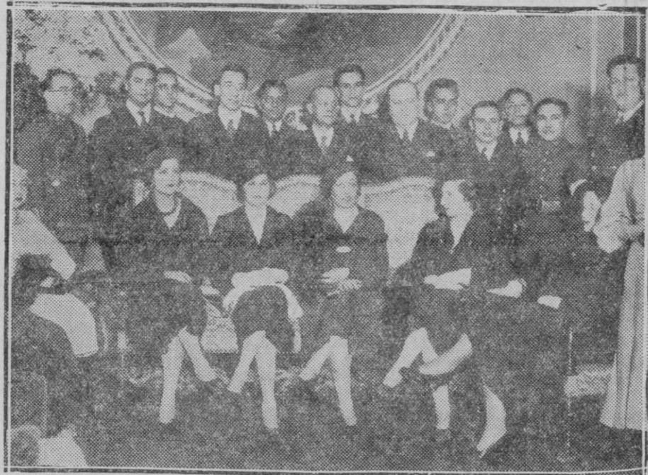
Recepción celebrada en el Ministerio de Marina en honor de los oficiales de la Armada mejicana que se encuentran en Madrid

Muy satisfechos de la campaña que hubimos de iniciar y que hemos mantenido contra el pretendido aumento de las tarifas telefónicas, la habremos de mantener y hemos de excitar a todos a mantenerla, hasta que consigamos una resolución definitiva y satisfactoria.