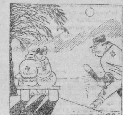
In Fraganti.—La policía francesa campeando por la moral y las buenas costumbres (Leningradskia Pravda)

una tara mortal, sin prestigio y condenada de anemamo al fracaso que estamos presenciando. Véase lo que ocurre en estos días algunas de las dilatadísimas y despoiladas repúblicas suramericanas en las que, a pesar de los consejos, de las excitaciones y aun de las mediaciones de la S. de N. se sigue guerreando por absurdos litigios de fronteras sin hacer el menor caso del organismo ginebrino. Observemos lo que pasa con el Japón y China, y a