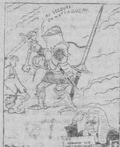
El problema insoluble o... Los virtuosos de Ginebra. (Ezvestia, Moscú)

de los gases de todas clases y de las caretas protectoras, que habrán de usar no solamente los soldados sino que también los ciudadanos pacíficos, pues la guerra que estable, si estalla, como se teme, no será entre ejércitos, sino entre los pueblos, sin distinción de clases, edad, ni sexo.