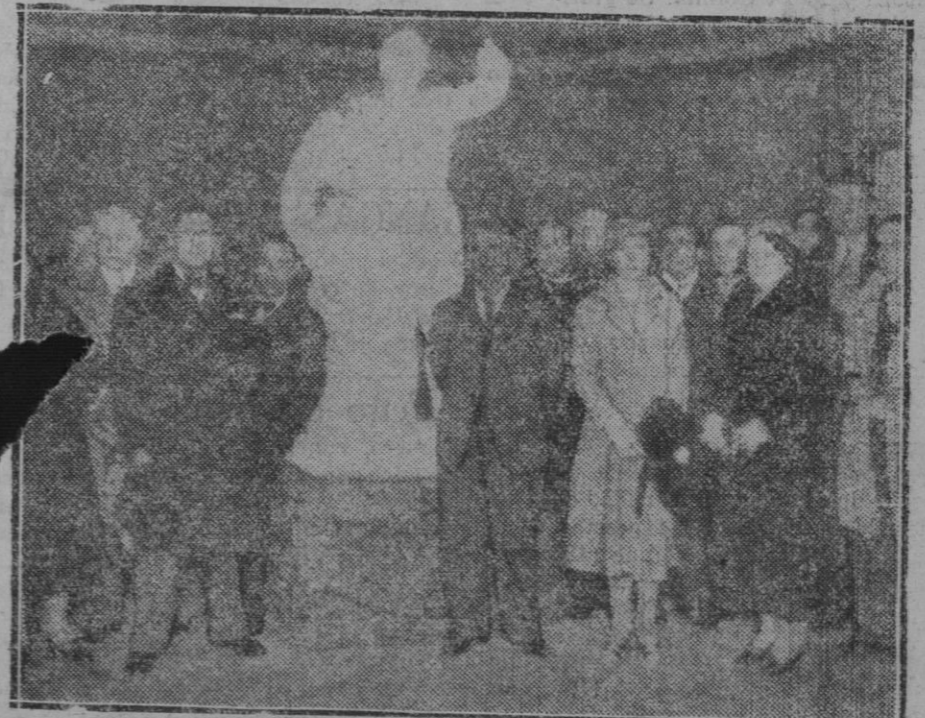
MADRID. — Exposición de escultura de José Planes, en el Círculo de Bellas Artes

—No. Yo no fumo. Solo entretengo este cigarrillo para que no se apague mientras vuelvo a dormir.