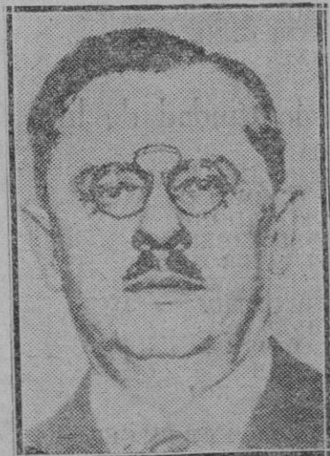
EXTRANJERO. — El Sr. Maljapetz que preside el nuevo Gobierno checoslovaco