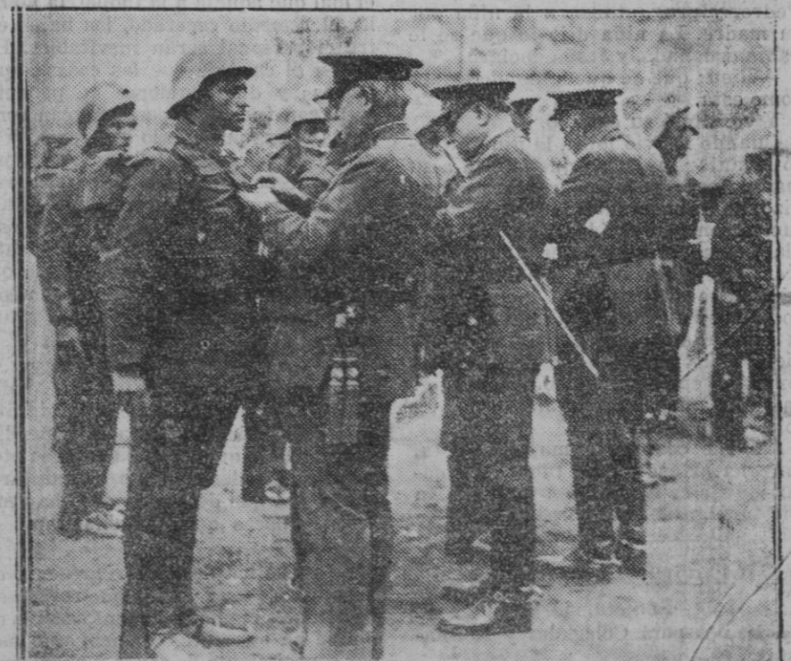
MADRID.—Fiesta del Soldado.—Entrega de premios a los vencedores de la carrera en patrullas.—Momento de imponerles el galardón a los soldados vencedores.