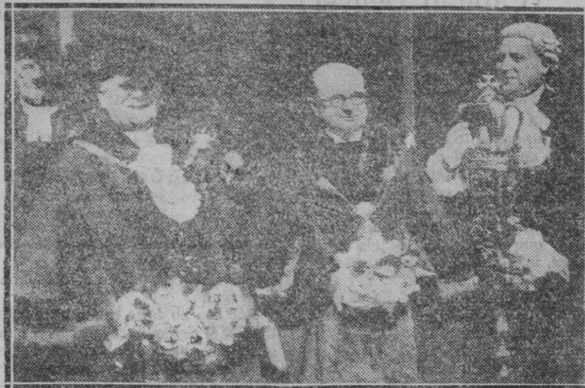
LONDRES.—A la izquierda el nuevo alcalde de Londres elegido por el pueblo, a quien su antecesor a la derecha, acaba de dar posesión de su cargo.

En el impetu destacan los delegados andaluces y extremeños; el contacto con los extremistas, el trasiego de masas descontentas empujadas por la propaganda, les ha desplazado de posiciones moderadas para lograr puestos de vanguardia. Más que ideología sazonal diríamos que es el instinto de con-