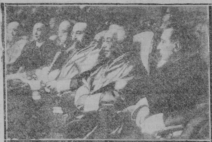
CALINA (CORDOBA).—D. Niceto Alcalá Zamora, Presidente de la República, con el Sr. De los Ríos y otras personalidades en la inauguración del curso académico en el Instituto de Calina

En Alemania ha sido el paro universitario, la superabundancia de profesiones liberales la mejor fuerza que ha tenido a su servicio el hitlerismo. Las tropas de asalto han sido formadas, principalmente, por universitarios sin ocupación que han buscado en este arriesgado empleo una manera de resolver inmediatamente el problema del hambre. Gentes desplazadas de sus ocupaciones intelectuales son inadecuadas a todos los medios y ellos son a la vez que una amenaza para la seguridad del Estado un cáncer social mucho más