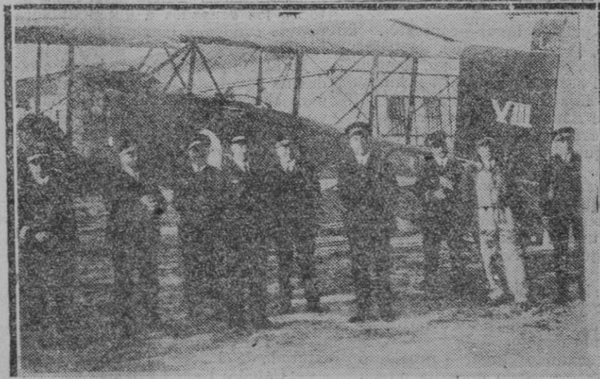
MADRID.—Los oficiales pilotos y observadores franceses que forman la expedición militar francesa, en el aeródromo de Getafe poco después de su llegada

Y habló luego de trenes de sondeo, de aprovechamiento de las cuencas del Nekor, Nekor, Martín... De construcción de carreteras, con fines comerciales y turísticos... Un plan abiertamente revolucionario, como se ve, coronado por otro proyecto, que hace la revolución insólita del de reducción de plantillas. ¿A dónde vamos a parar, Dios muestre? ¿Colonización y reducción de