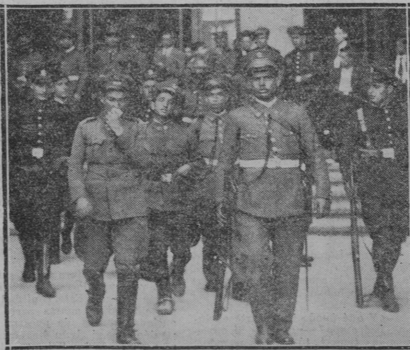
MADRID. — DEL MOVIMIENTO REVOLUCIONARIO. — Unos soldados de la remonta detenidos y custodiados por guardias de asalto, al sacarlos al Palacio de Comunicaciones.