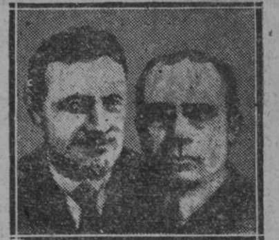
Francisco Ercole, rector de la Universidad de Palermo, que se ha hecho cargo de la cartera de Educación Nacional en el Gabinete italiano, reorganizado recientemente. Pedro de Francesi, rector de la Universidad de Roma, nuevo ministro de Justicia.