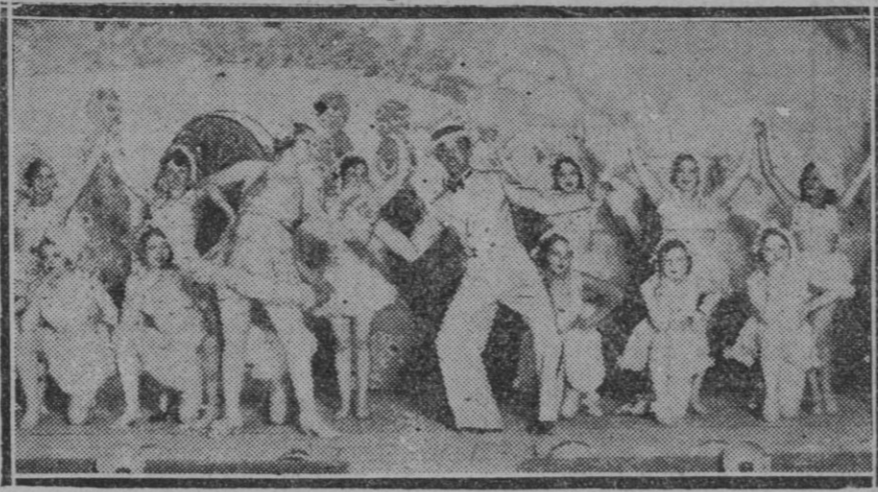
Madrid. — Una escena de la revista "Las Meninas" de Capellá Lucio y el maestro Díaz Giles, estrenada con mucho éxito en el teatro Fuencarral

ALVAREZ DE LEON (Prohibida la reproducción).